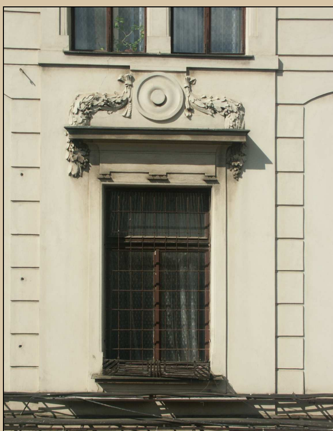
celkový pohled z exteriéru