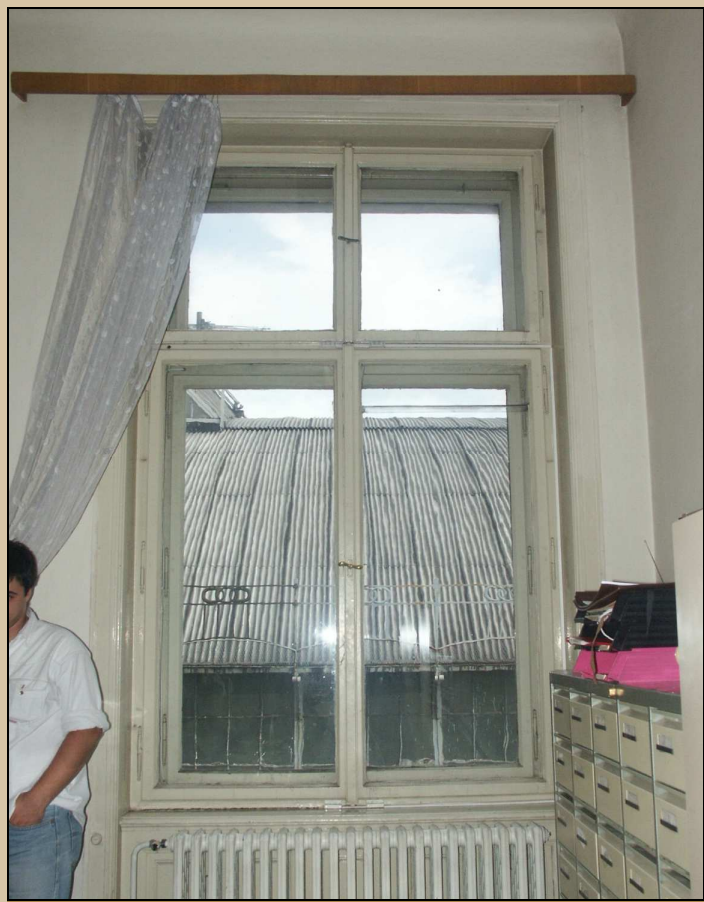
celkový pohled z interiéru