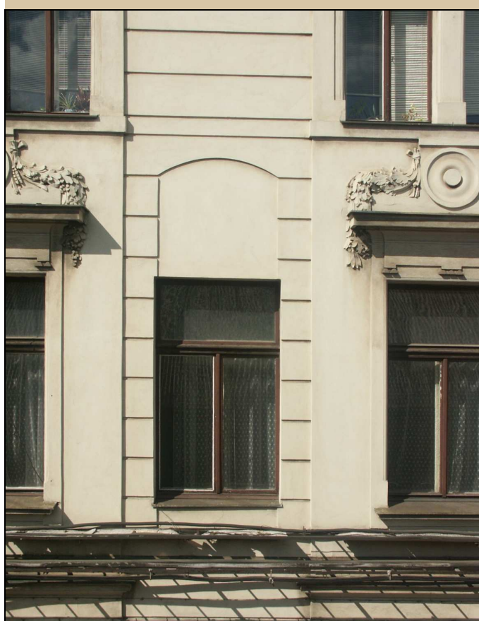
celkový pohled z exteriéru