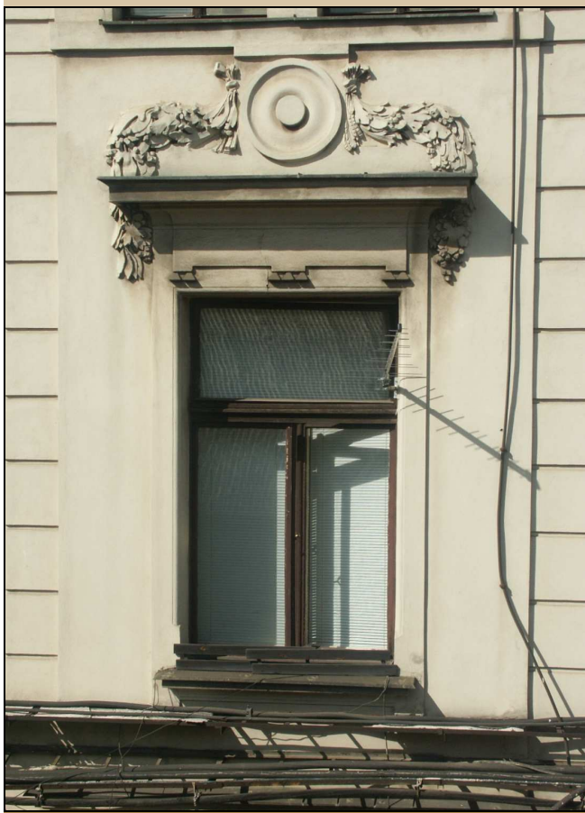
celkový pohled z exteriéru